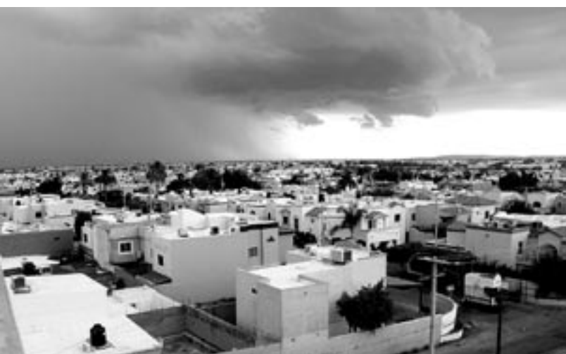
Una fuerte tormenta que pasa por el Surponiente de la ciudad, se observó en esta toma desde lo alto del edificio Las Palmas ubicado en Solidaridad y calle Hidalgo en la colonia Palmar del Sol.