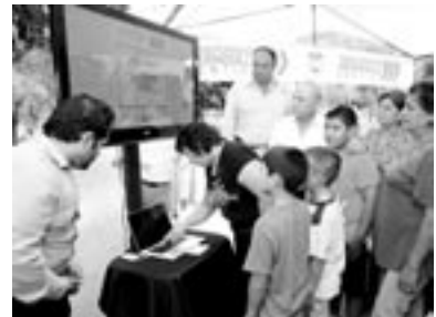
El alcalde de Hermosillo, Javier Gándara Magaña, está cerca de llegar a la meta trazada al inicio de su administración en cuanto a pavimentación se refiere.

La calle donde se realizó la suma de estos más de 6 mil metros cuadrados fue la ubicada en la colonia Irrigación, donde se realizaron trabajos en la calle Canal Principal,