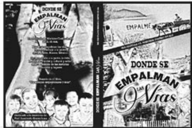
“Donde las vías se empalman”, se presentará hoy.

Esta película está basada en el libro “Personajes empalmen-